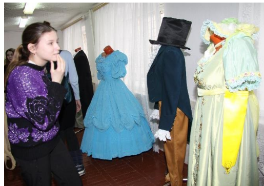
Станция «Технологии моды»