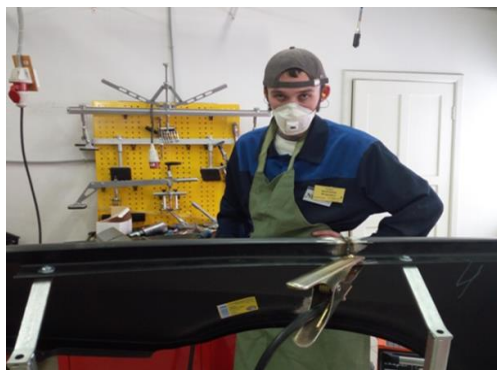
Станция «Ремонт авто»