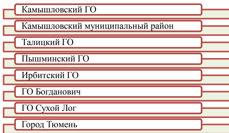
Рисунок 2 – Территории, участвующие в Проекте «Старт в будущее» (3 сезон, 2020-2021)

Задачи, отраженные в заявке на признание образовательной организации региональной инновационной площадкой реализованы на достаточном уровне.