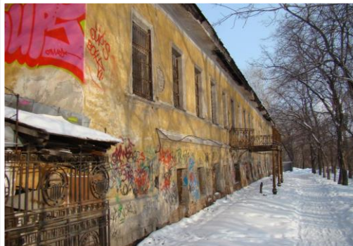
Вид со стороны Тагильского пруда.