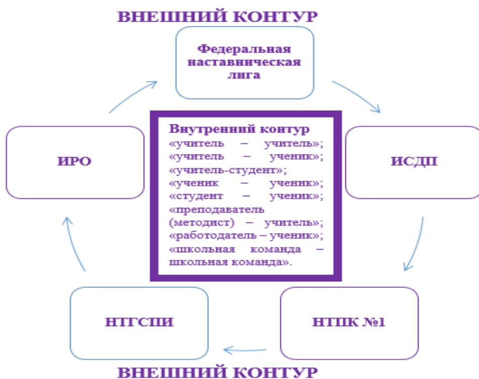
Рис.1. Модель наставничества в МАОУ гимназия №18

Система наставничества гимназии характеризуется «внутренним» и «внешним контуром» образовательной организации.