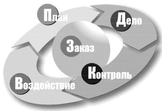
Рисунок 1. Цикл Деминга

Практический опыт внедрения систем управления качеством образования позволяет выделить основные стадии управления качеством (Рисунок 1).