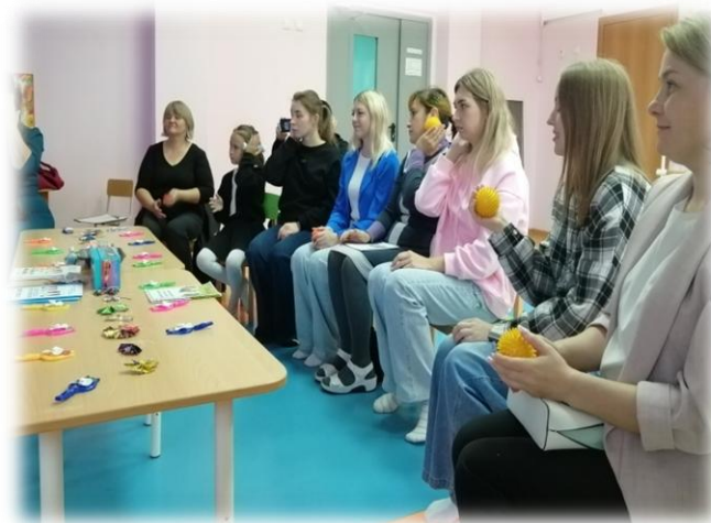
Фокус группа 2 Речевое развитие