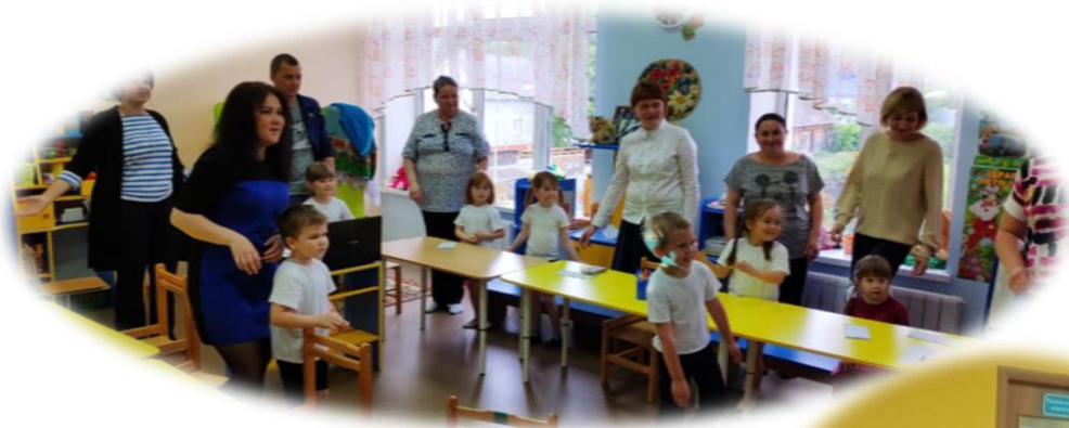
Фокус группа 1 Развитие ценности здоровья

Ячейка для взаимодействия - фокус-группа родителей, объединенных выявленными в ходе диагностики общими интересами