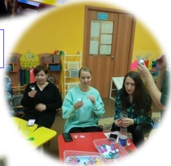
Фокус группа 3 Развитие творческих способностей