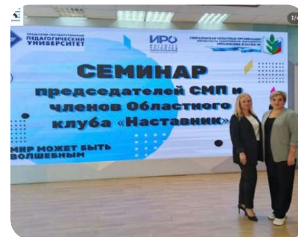
16.09.25 Областной семинар представителей СМП и областного клуба «Наставник»