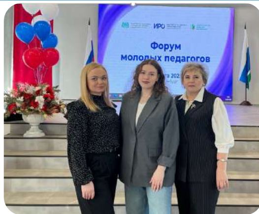
27.03.25 Региональный Форум молодых педагогов